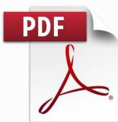
出品プログラム（簡易版）資料作成ガイド.pdf